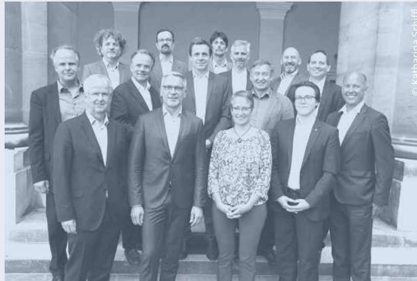
Konstituierung des DECA-Beirats im April 2019