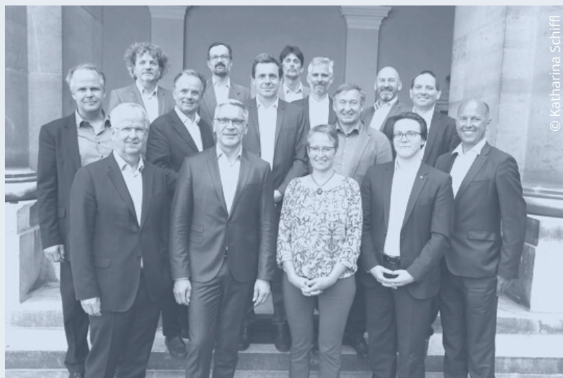
Konstituierung des DECA-Beirats im April 2019

Assistenz a.bascone@deca.at 0660 75 37 620